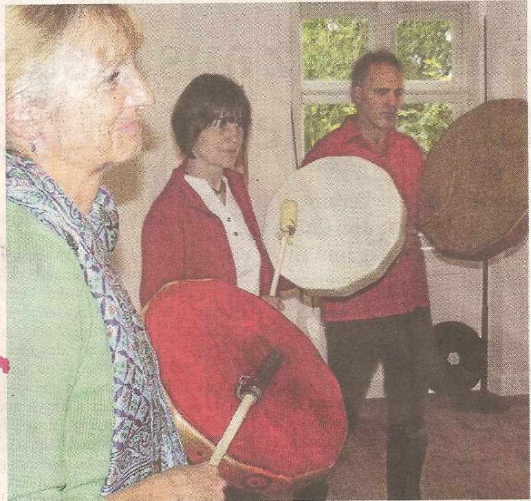
Trommeln für das Schloss: Bei „Artello“ standen die Tore offen.

► Beginn: Sonntag, 10 Uhr, Mehrzweckhalle. Geöffnet ist durchgehend bis 17 Uhr und am Nachmittag gibt es Kaffee und Kuchen zugunsten des Trainer Arbeitskreises „Eine Welt“. (mz)